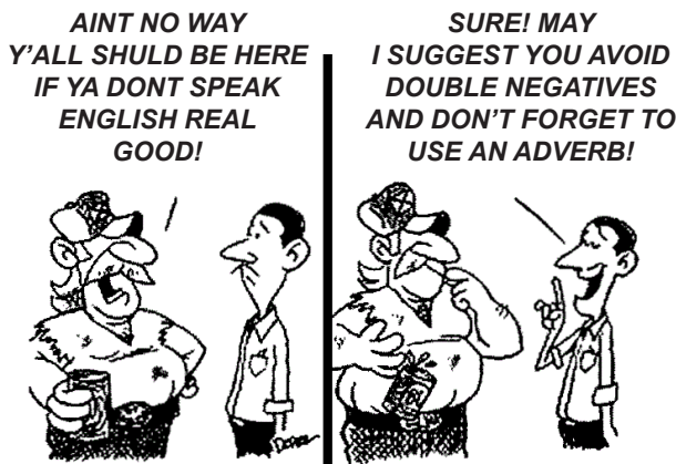
DONAR. Disponível em: http://politicalgraffiti.wordpress.com . Acesso em: 17 ago. 2011

Cartuns são produzidos com o intuito de satirizar comportamentos humanos e assim oportunizam a reflexão sobre nossos próprios comportamentos e atitudes. Nesse cartum, a linguagem utilizada pelos personagens em uma conversa em inglês evidencia